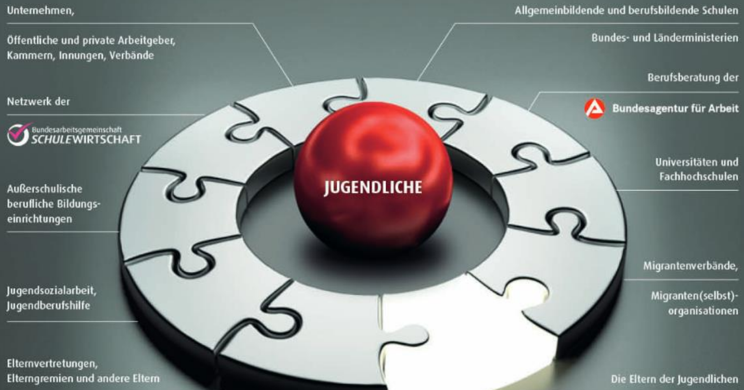
Abb: Bundesagentur für Arbeit; Bundesarbeitsgemeinschaft SCHULEWIRTSCHAFT (2014): Leitfaden Elternarbeit. Eltern erwünscht? Wie Zusammenarbeit in der Berufs- und Studienorientierung gelingen kann.